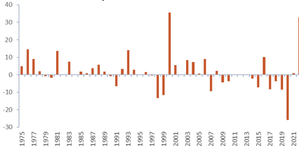
Indici globali MSCI value vs MSCI growth (rendimenti relativi annuali)

Un lettore accorto potrebbe anche chiedersi: cosa significa il titolo di questo articolo? Si riferisce all'annullamento del divario tra i cosiddetti titoli value e growth, vale a dire il Grande Reset, osservato solo in tre occasioni negli ultimi cinque decenni (cfr. grafico seguente):